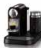
Nespresso Citiz Frost Aluminium