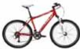
Bicicleta de montaña