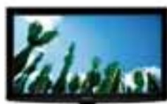
LCD 37" FULL HD